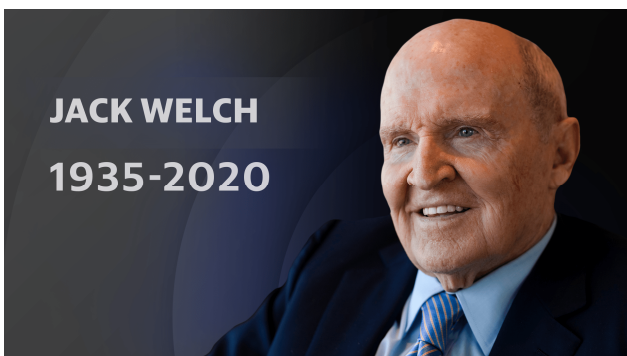
แจ็ก เวลช์ (Jack F. Welch)

อะไรที่คิดว่าเกี่ยว...บางทีก็กลับไม่เกี่ยว อะไรที่คิดว่าทำนายได้ เอาเข้าจริง...กลับบอกอะไรไม่ได้เลย เพราะมีปัจจัยอื่นที่คิดไม่ถึง แต่ที่ยอวยมากมาย ยกตัวอย่าง ตั้งเป้าสร้างความมั่งคั่งจากตลาดหุ้น (1 ไป 2)